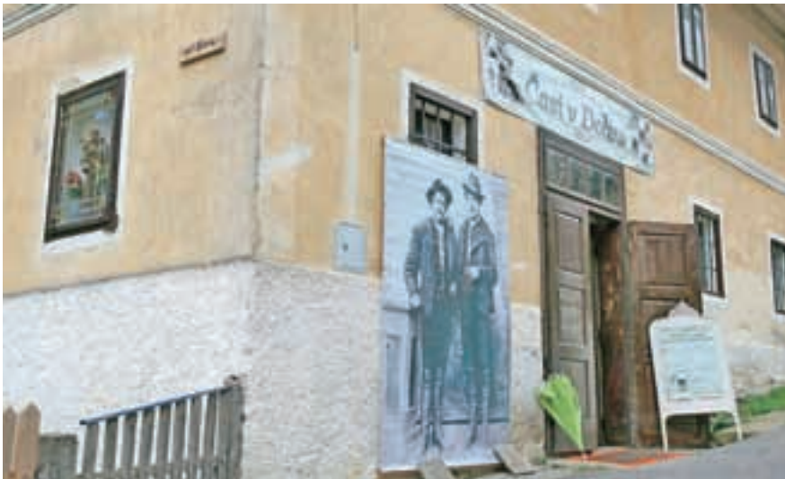
Šimnova hiša danes