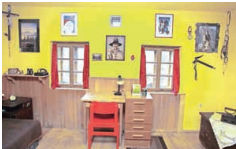
Domačija Filipa Benceta, svetovno znanega alpinista in gorskega reševalca, ki se je smrtno ponesrečil 3. aprila leta 2009. Na fotografiji je njegova soba, takšna, kot je bila, ko je v njej še živel.