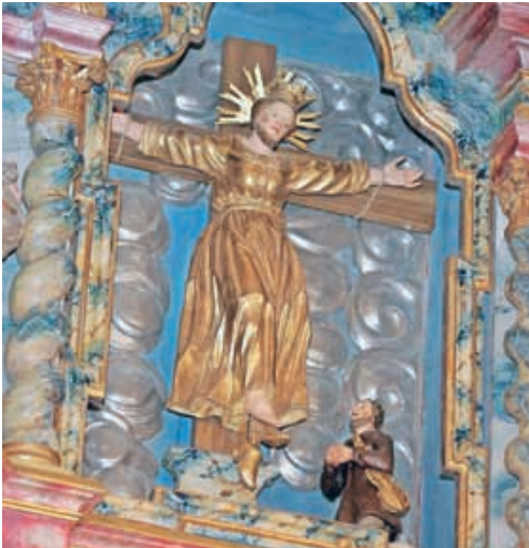
Sv. Kuma poseblja hči bogate gosposke, ki je zavračala poroko z izbranim ženinom, ker se je zaobljubila Kristusu.