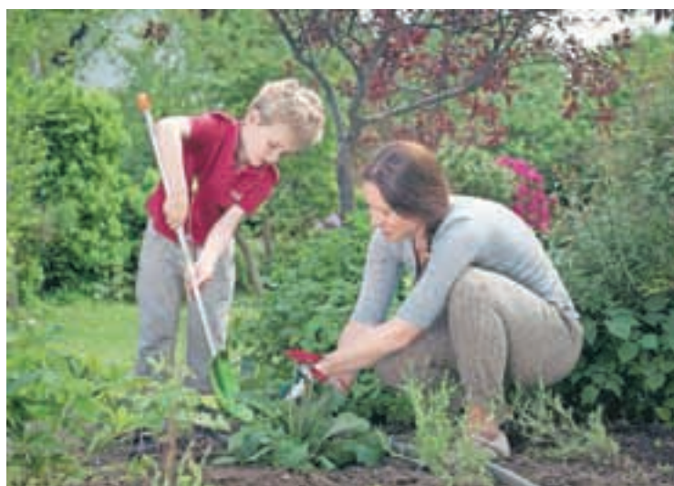
Otroci radi pomagajo, s primernim orodjem pa še toliko raje.