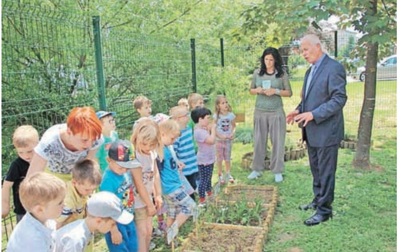
Predstavitvev otroškega orodja za vrt na Brdu pri Kranju