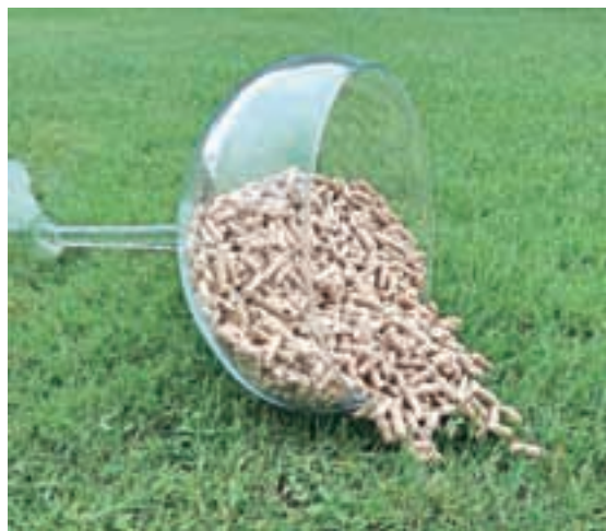
DA za pelete

Kamini že dalj časa niso samo okras doma, ampak postajajo pomemben in enakovreden vir ogrevanja. Razlikujemo dve osnovni izvedbi kaminov. Prvi so toplozračni in se uporabljajo neposredno za ogrevanje enega velikega ali več povezanih prostorov. Drugi so toplovodni in samo približno 20 odstotkov toplote oddajo neposredno v prostor, preostalo toploto pa prenesejo preko cevne sistema v klasično centralno ogrevanje objekta. Uporabijo se lahko kot osnovni ali kot dopolnilni vir toplote. Kamini se razlikujejo tudi po vrsti kuriva, ki ga uporabljajo. Lahko so za polena ali za pelete ali kombinirani. Ti kamini so opremljeni z zalogovnikom za pelete in vso potrebno avtomatiko za samodejno delovanje.