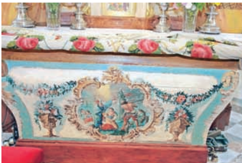
Baročni motiv na glavnem oltarju. »Gre za prvotno poslikavo te mize, lahko da bi jo poslikali v Layerjevi delavnici, ampak so bili njihovi kasnejši posnemovalci,« je pojasnil Fras.