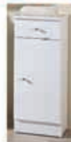
Omarica bela 36x28x84 19,90€