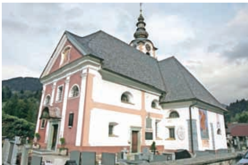
Cerkev sv. Katarine v Lomu pod Storžičem

Cerkev sv. Katarine ima več oltarjev, še posebej pritegne Marijin oltar, ki so ga blagoslovili pred nedavnim po zaključku restavratskih del. »Nekaj posebnega je arhitektura Marijinega oltarja, tega še nisem kaj dosti zasledil