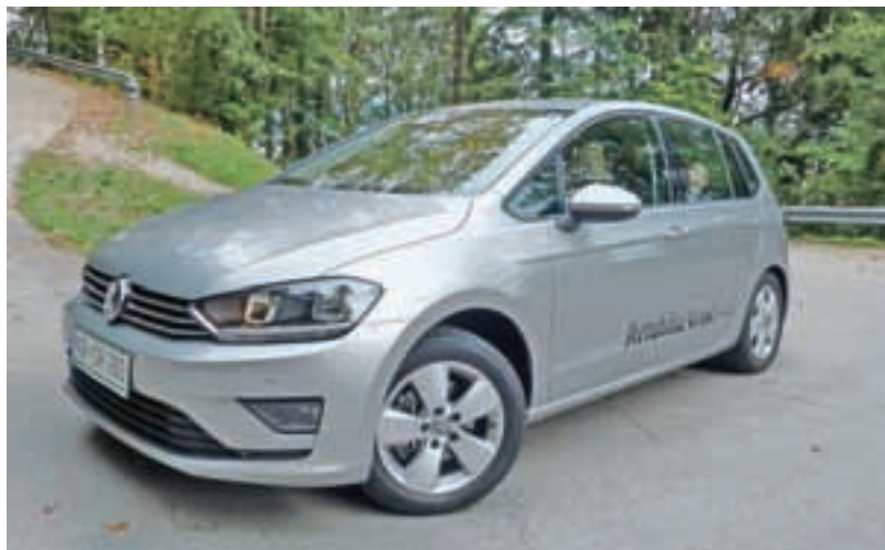
Klasika in tehno gresta s sportsvanom krasno skupaj.

Sportsvana uvrščam v kategorijo družinskih avtomobilov. In prav zato, ker ga uvrščam med družinske, sem prišel na idejo, da z njim popeljem celo družino. V slovenskih medijih je cel kup suhoparnih testov avtomobilov, ki so sicer berljivi, vendar imam venomer občutek, da to delajo že tako rutinsko, da bralec na koncu ne ve, ali naj predstavljeni avto kupi kar takoj ali naj počaka na naslednji test. Testi in predstavitev pa se vrstijo kot po tekočem traku ... K sreči sta otroka še tako mlada, da ne znata drugače komentirati kot direktno in odkrito. Sin, ki je starejši, je bil jasno navdušen nad vse elektroniko »na dotik« oziroma »na touch«, kar je še najbolj podobno njegovima telefonu in tablici. In ko je odkril še predal, v katerem sportsvan skriva CD-predvajalnik ter vse USB-priključke, je bil toliko bolj vznemirjen. Hčer, ki je mlajša, je