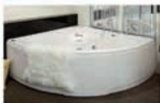
(oglašena kupovina!) A7- 2012 (100 funkcij) 150x150x63 1504€