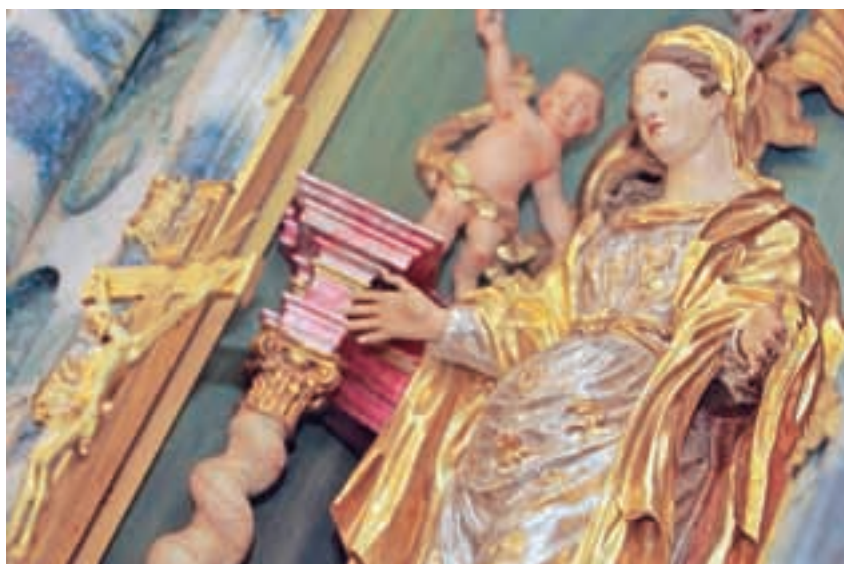
Edinstven kip Marije v blagoslovljenem stanju