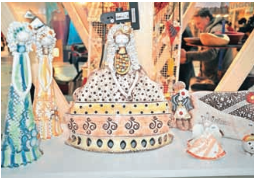
»Med tistimi, ki so kupili največ mojih izdelkov, so zagotovo Američani, Angleži, tudi Francozi in Italijani. In ja, tudi Slovenci vse bolj cenimo ročno izdelane izdelke, zato ne zaostajajo kaj dosti!«