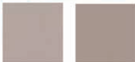
Tehnični gres bež - sivi 30x30 5,90€