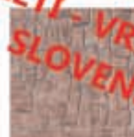
Protidrnsni granitogres NUSK 33.3x33.3 12,20€