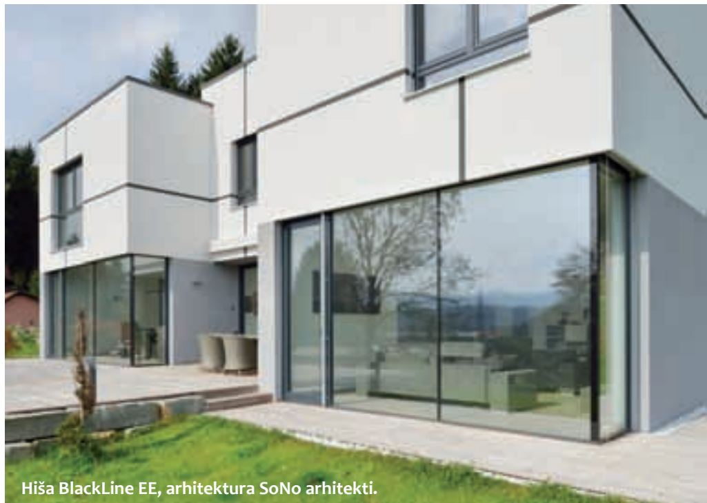
Hiša BlackLine EE, arhitektura SoNo arhitekti.

so tipske hiše, ki so sodobno oblikovane, energetske učinkovite in okolju prijazne. Pri njih tako že dolgo ne velja, da je arhitektura le videz, ampak je v ospredju tudi in predvsem funkcionalnost hiš. Ob pestri kataloški ponudbi sodobnih arhitekturnih rešitev ponujajo širok spekter možnosti dodatnega individualnega prilagajanja. Te s funkcionalnimi in oblikovnimi intervencijami upoštevajo individualne zahteve, skladnost z okoljem posameznih lokacij in negujejo tesen odnos do obstoječih prostorskih kvalitet.