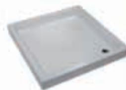
Keramična kad 90x90x11 104,30€