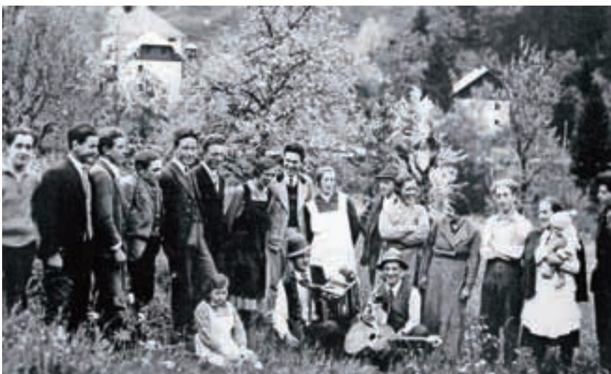
Dolinski fantje in dekleta na Brusovem travniku