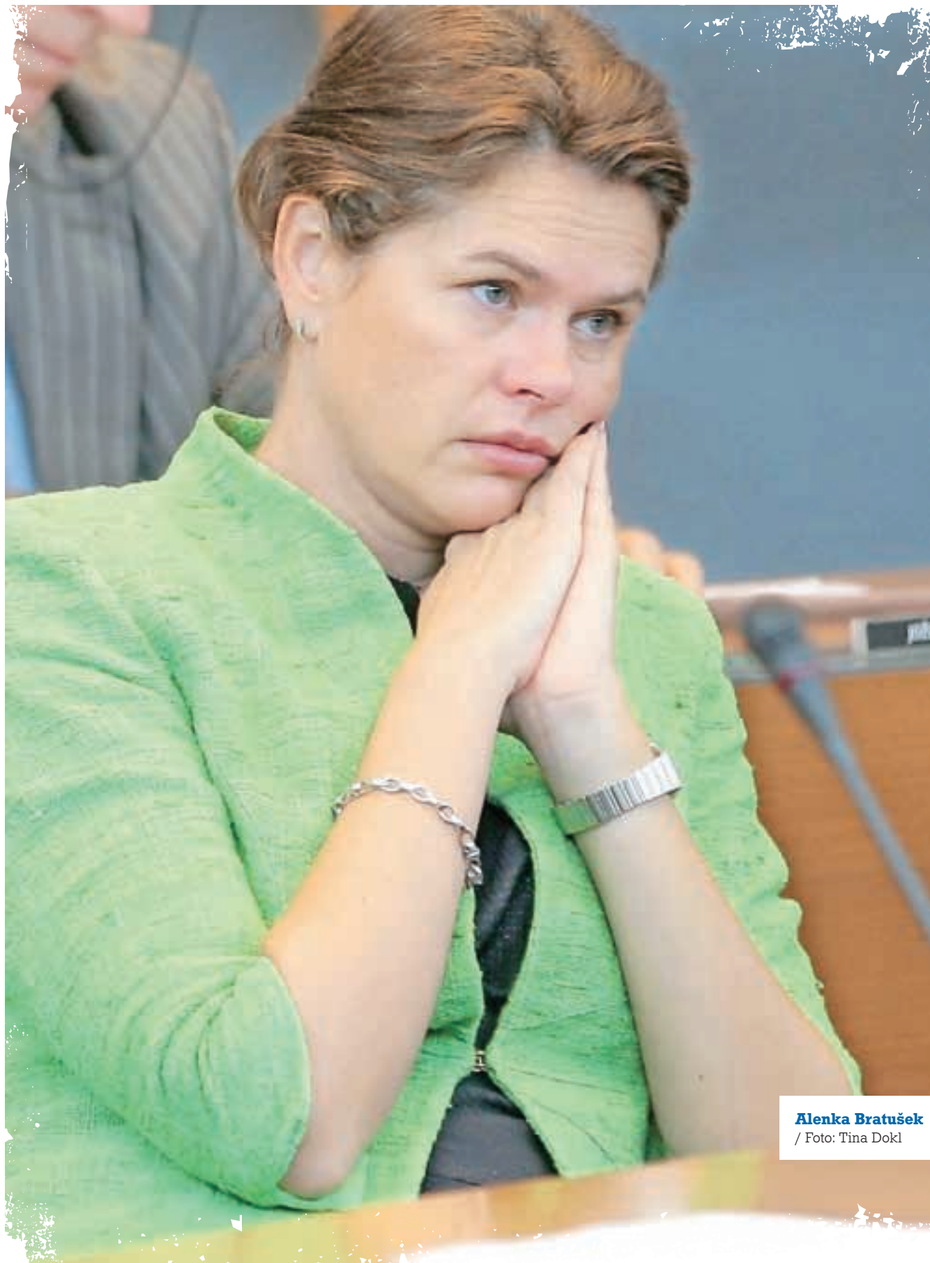
Alenka Bratušek