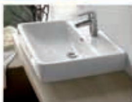
Napuljni umivalnik PRO 55x48 105€

PROIZVODNJA, INŽENIRING, TRGOVINA D.O.O. Šuceva 23, 4000 Kranj www.dolnov.si TEL: 04 201 30 00 dolnov@dolnov.si