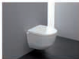
Viseči WC PRO - 132€ Deska PRO - 65€