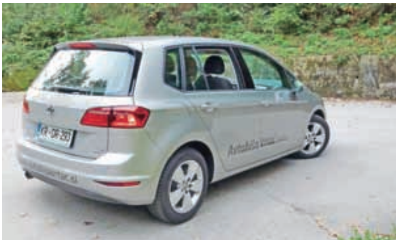
Golf sportsvan je lep z vseh strani.

najbolj navduševala tišina motorja. »A ta avto sploh dela?« je vprašala že nekaj metrov po tem, ko smo speljali z dvorišča. Ko smo prišli do prvega semaforja, je rekla: »No, zdaj je pa čisto crknill!« Revica je pozabila, kako smo jo hecali že s sistemom start-stop. Potem sem