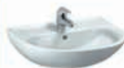
Umivalnik PRO 55x44 66,5€