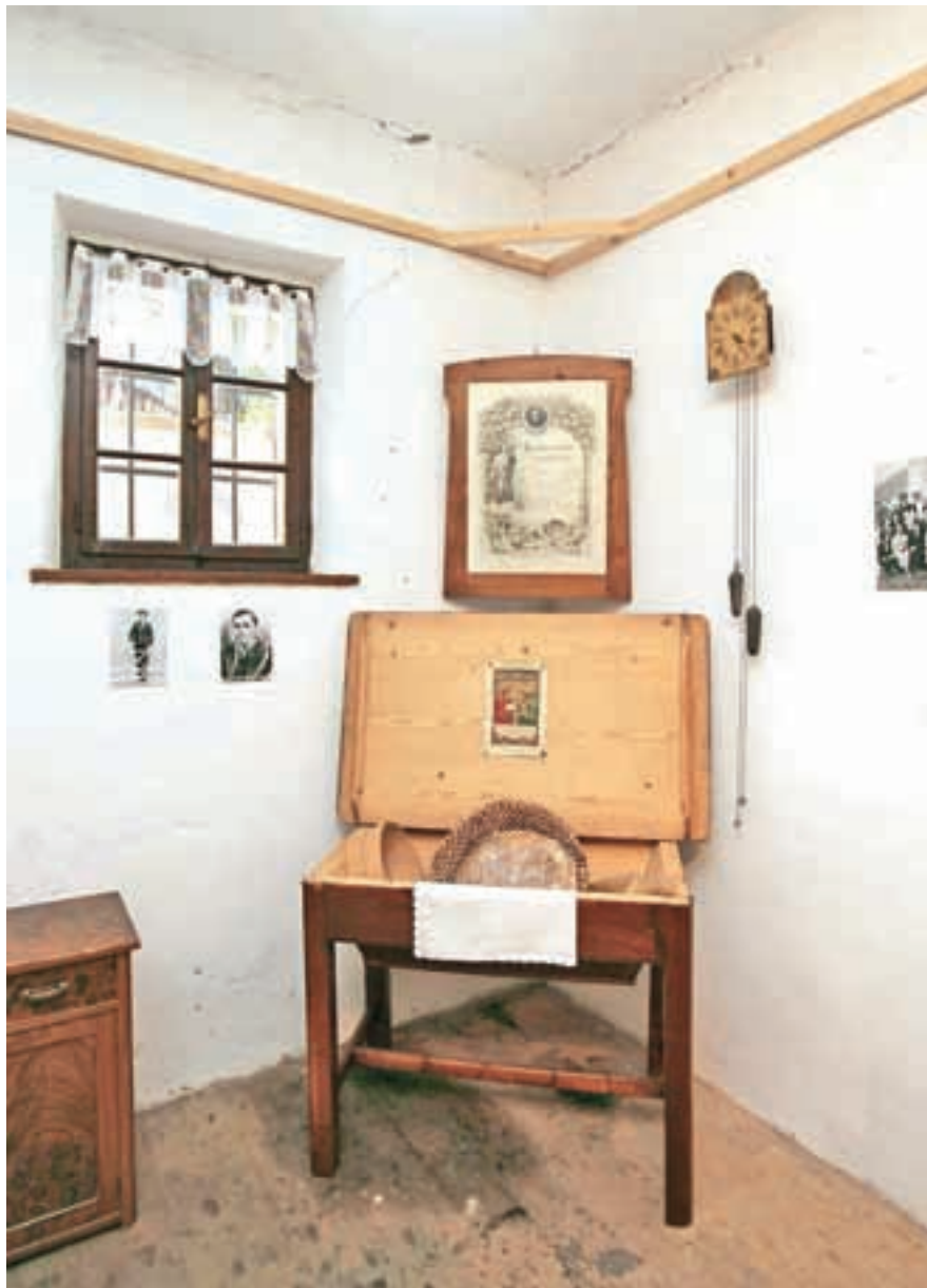
Opremo za Šimnovo spominsko sobo so podarili Dolinci.

Spomladi so odprli Šimnovo spominsko sobo z razstavo Časi v Dolini - sprehod skozi zgodovino naših prednikov. Predstavljena je tematika iz družabnega življenja v obdobju od konca 19. stoletja do konca 2. svetovne vojne. Fotografije prikazujejo življenjski utrip naših očetov, babic, pradedov ... in nam tako približajo življenje Dolincev več rodov v preteklosti.