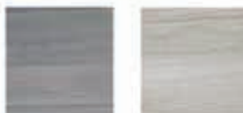
Elegantni Travertin granitogres 33x33 9,00€